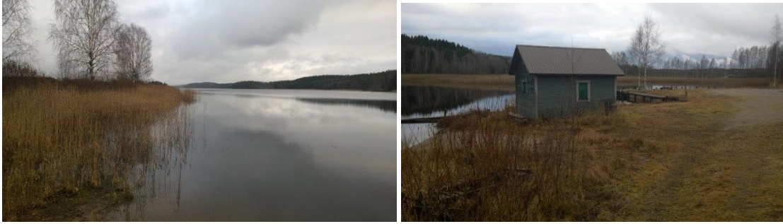
Nykyisen rakennuspaikan alavaa rantaa ja viereinen venesatama, jonka saunaa kyläläiset voivat käyttää

Vapaan rannan osuus säilyisi kokonaisuutena täysin ennallaan kaavamuutoksen myötä, mutta rakentaminen olisi paremmalla paikalla toteutuksen suhteen. Lavikanlahdelle peltomaisemaan muodostuisi merkittävä vapaan rannan jakso. Kaavamuutoksen tavoitteet ovat sopusoinnussa alkuperäisen yleiskaavan tavoitteiden ja mitoitusperusteiden kanssa. Uusia rakennuspaikkoja ei muodosteta vaan nykyinen rakennusoikeus siirretään toteuttamisen kannalta parempaan paikkaan. Pinta-alaltaan rakennuspaikka voidaan supistaa huomattavasti alkuperäisestä yksityiskohtaisen maastotarkastelun jälkeen.