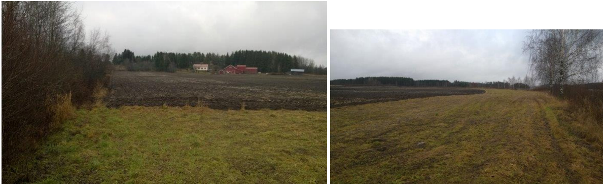
Suunnittelualuetta rannalta päin kuvattuna, taustalla tilan talouskeskus

Kaavamuutosalue on tällä hetkellä tavanomaista peltoa, jolla on merkitystä varsinkin avoimena alueena liittyen kylän kulttuurimaisemaan.