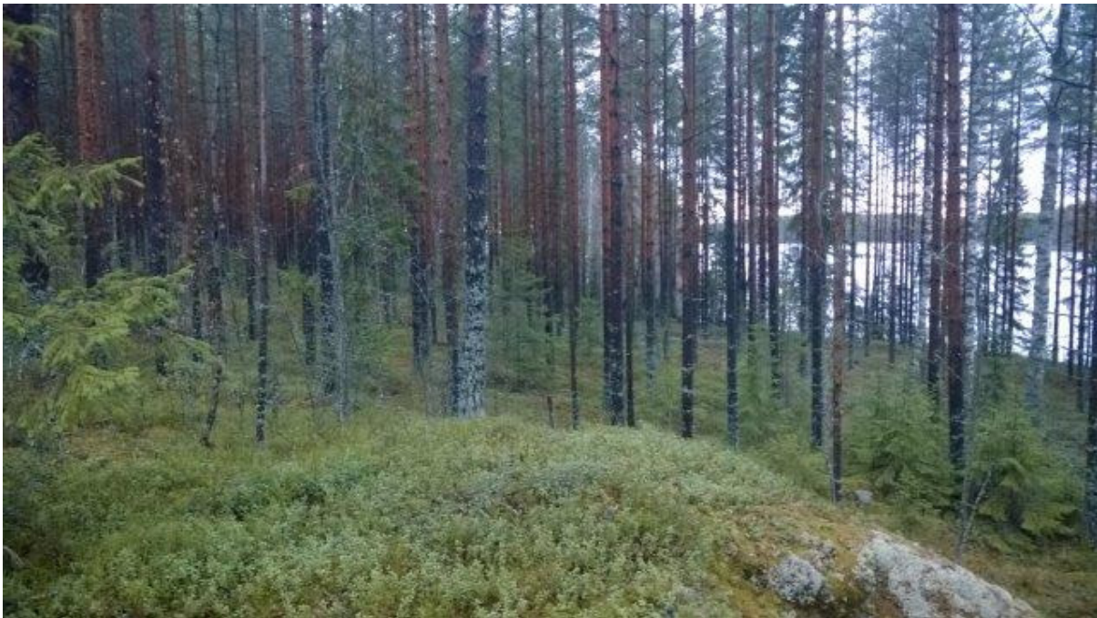
Siirron kohteena olevaa Kuolimon Kallioniemen kaakkoisen alueen rantaa, ei erityisiä luontoarvoja

Vapaan rannan osuus säilyisi kokonaisuutena täysin ennallaan kaavamuutoksen myötä, mutta rakentaminen olisi paremmalla paikalla toteutuksen suhteen. Lavikanlahdelle peltomaisemaan muodostuisi merkittävä vapaan rannan jakso. Kaavamuutoksen tavoitteet ovat sopusoinnussa alkuperäisen yleiskaavan tavoitteiden ja mitoitusperusteiden kanssa. Uusia rakennuspaikkoja ei muodosteta vaan nykyinen rakennusoikeus siirretään toteuttamisen kannalta parempaan paikkaan. Pinta-alaltaan rakennuspaikka voidaan supistaa huomattavasti alkuperäisestä yksityiskohtaisen maastotarkastelun jälkeen.