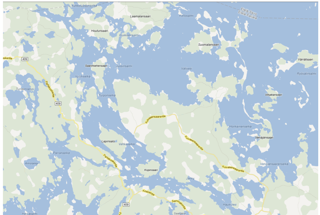
Suunnittelualueen seudullinen sijainti

Yleiskaavan muutoskohteet sijaitsevat Savitaipaleen kunnassa Suur-Saimaan ranta-alueilla.