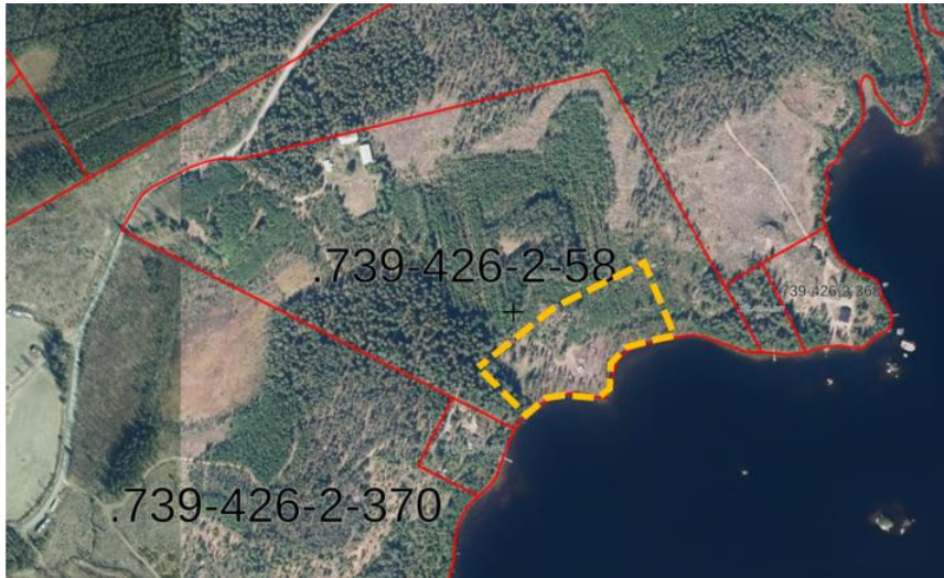
Kuva 1. Suunnittelualueen likimääräinen raja- ja sijainti ilmakuvassa keltaisella

Kaava-alue sijaitsee Savitaipaleen keskustan ulkopuolella Laakon kylän tuntumassa Säynjärven rannalla. Savitaipaleen kirkonkylälle on alueelta matkaa noin 7 kilometriä. Noin 1,4 ha:n kokoinen suunnittelualue koskee osaa tilasta Koivula 739-426-2-58. Yleissilmäyskartta alueen sijainnista on kansilehdellä.