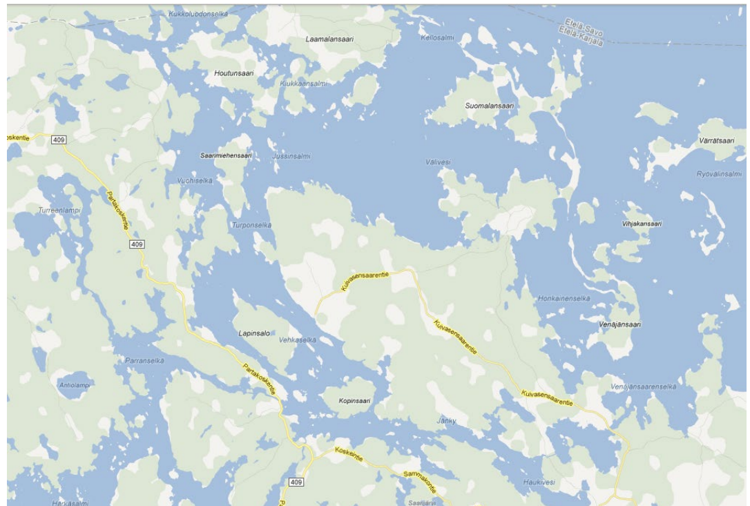
Suunnittelualueen seudullinen sijainti

Yleiskaavan muutoskohteet sijaitsevat Savitaipaleen kunnassa Suur-Saimaan ranta-alueilla.