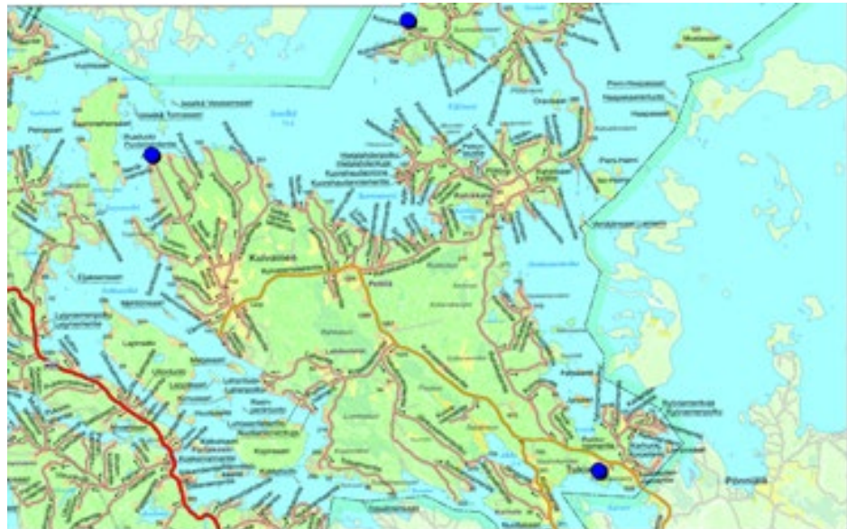
Suunnittelukohteiden seudulliset sijainnit

Yleiskaavan muutoskohteet sijaitsevat Savitaipaleen kunnassa Suur-Saimaan ranta-alueilla.