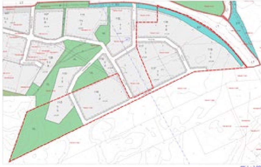
Asemakaavaote ja alueen alustava rajaus

Kaakkois-Suomen ympäristökeskuksen 22.4.1997 vahvistama asemakaava. Asemakaavassa on osoitettu varauksia teollisuuteen (T), suojaviheralueisiin (EV), lähivikistysalueiin (VL) ja katualueisiin.